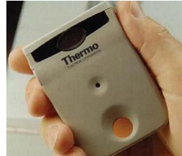
身体が受けた被爆量を計測