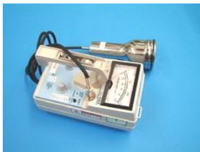
搬出物品等の汚染を計測