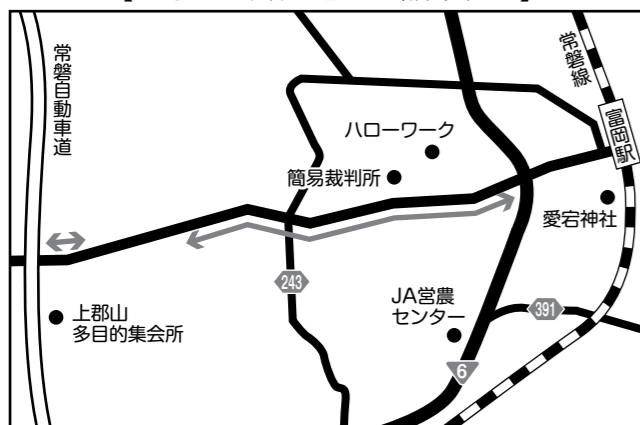
【西原・岩井戸地区の散布範囲】