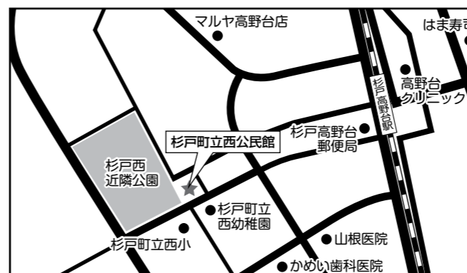
杉戸町立西公民館