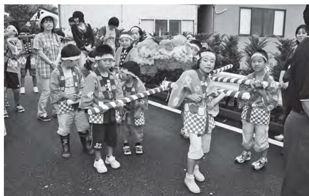
日吉神社夏祭り(2007年7月21日撮影)