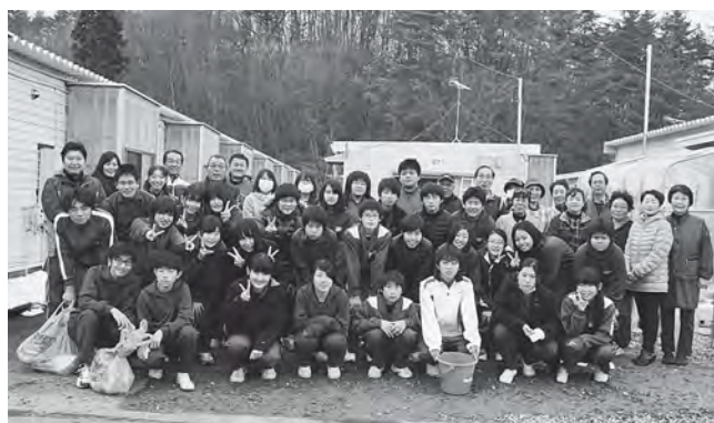
町立中学校三春校 熊耳応急仮設住宅ボランティア (2013年12月17日撮影)