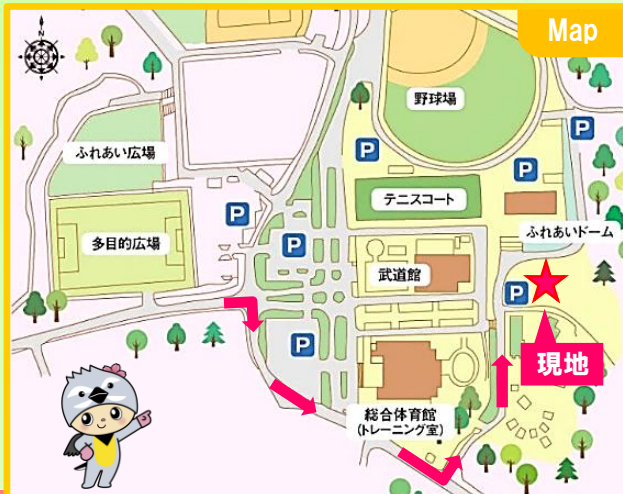
【現地詳細図】 富岡町グリーンフィールド内