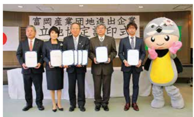
富岡産業団地進出企業立地協定調印式の様子(令和元年12月9日)