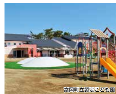
富岡町立認定こども園

富岡町の小・中学校では、ICT教育や多世代教育、認定こども園からの英語教育、さらに各分野の「プロ」を招き、生きる力を育む教育を取り入れるなど、少人数ならではの教育に取り組んでいます。また、認定こども園の保育料は無料、小・中学校の教材費、給食費などは原則無償化し、子育て世帯の負担軽減を図っています。