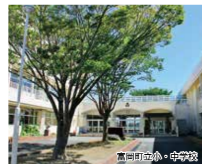
富岡町立小・中学校