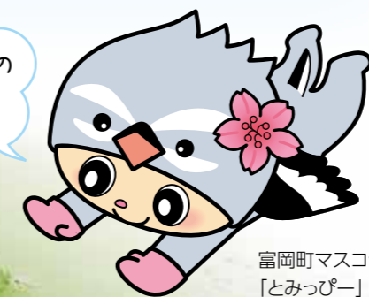
富岡町マスコットキャラクター「とみっぴー」