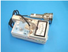
搬出物品等の汚染を計測