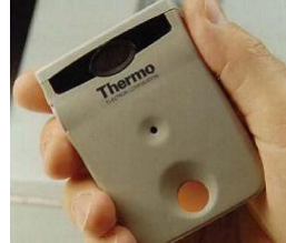
身体が受けた被爆量を計測