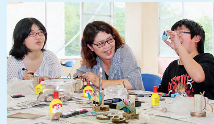
完成した作品を手に笑顔を見せる親子

親子と一緒に活動をする親子体験教室が9月8日、町立富岡第一・第二小学校三春校で行われました。