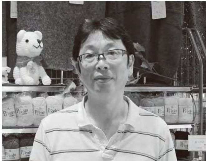
この地域で新たな一歩を刻み始めました

新店舗をオープン この春、建物が完成し新店舗をオープンしましたが、柏崎市周辺には双葉郡内からの避難者が多く、看板の「ヤマダヤ」というロゴを見て懐かしく感じ立ち寄る方もいらっしゃいました。多くの皆さんは、当店について「手芸用品の小売店」というイメージだと思いますが、震災前から小売りだ