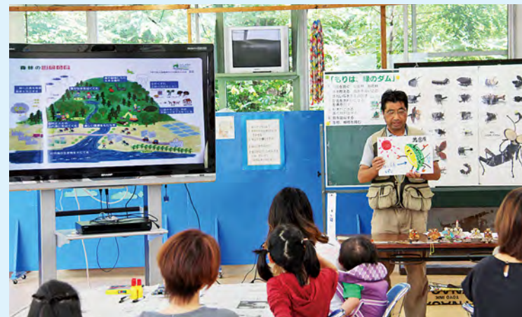
講師による森林のはたらきの説明