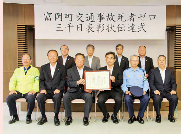
出席者全員で記念撮影

富岡町内での交通事故死者ゼロが、9月3日午前0時をもって3000日に達したことをうけ、福島県交通対策協議会長表彰の伝達式が5日、役場正庁で行われました。