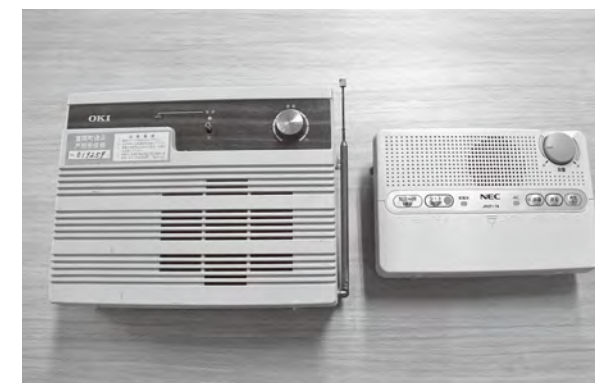
旧型戸別受信機(左)と新型戸別受信機