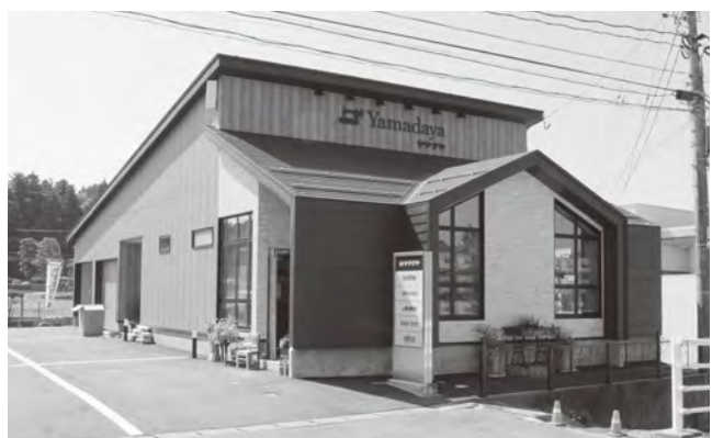
〒949-4143 新潟県柏崎市西山町和田802-4 電話 (0257) 48-2656 【営業時間】午前10時～午後7時(定休日:日曜・祝祭日、第3月曜日)

避難翌年、いわき市内に移りましたが、当時はまだ避難指示の解除など、帰還に向けた見通しが立っていませんでした。