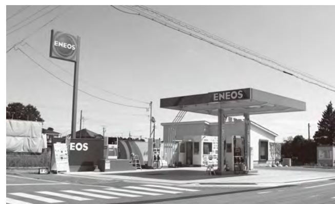
富岡町字夜の森南3-48 Tel (0240) 22-0777 【営業時間】午前7時～午後7時(土曜日は午後5時まで) 【定休日】日曜・祝祭日 スタッフ募集中!

帰還困難区域に最も近い給油所 避難指示区域の再編後、町内での事業再開の準備を始めました。本格的な町の復興は十年単位になると考え、負担は大きくなりますが給油所の建て替えを決断しました。安全上の規制など通常の店舗建設より難しいことが数多くありましたが、無事にオープンを迎えることができました。