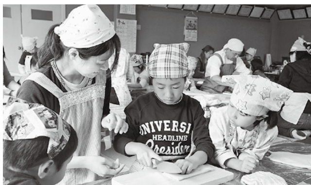
上手岡児童館 親子親睦会ラーメン作り (2009年10月19日撮影)