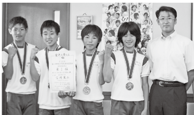
全国小学生陸上大会県選考会優勝報告(2009年7月28日撮影)