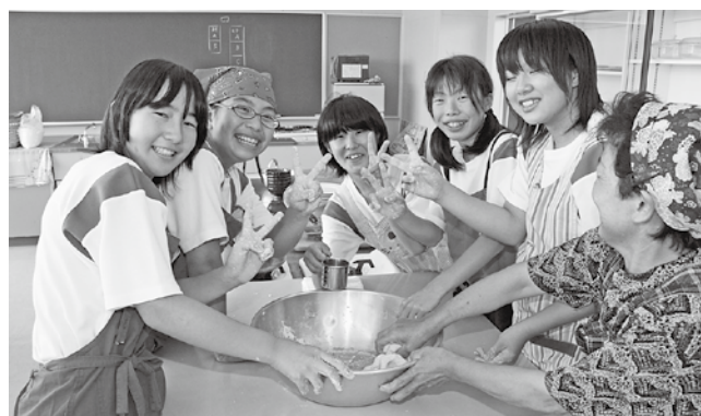
富岡二中総合学習(2007年9月14日撮影)