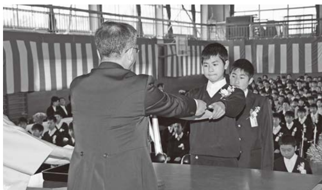
富岡一小卒業式(2008年3月21日撮影)