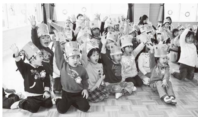
夜の森保育所クリスマス会(2007年12月20日撮影)