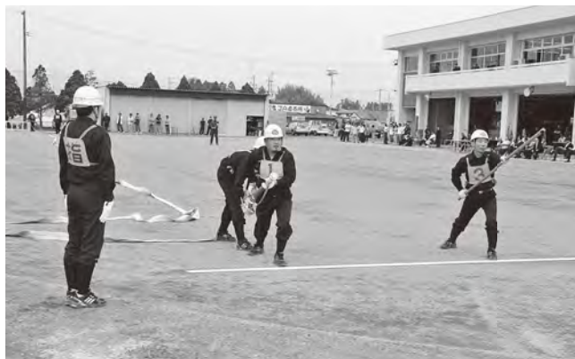
富岡町消防操法競技大会(2008年6月撮影)