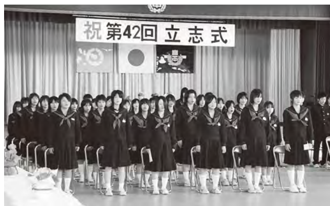
富岡第一中学校立志式(2008年2月撮影)