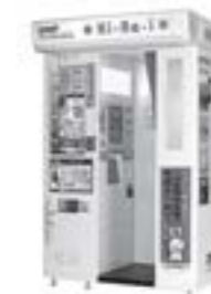
まちなかの証明用写真機