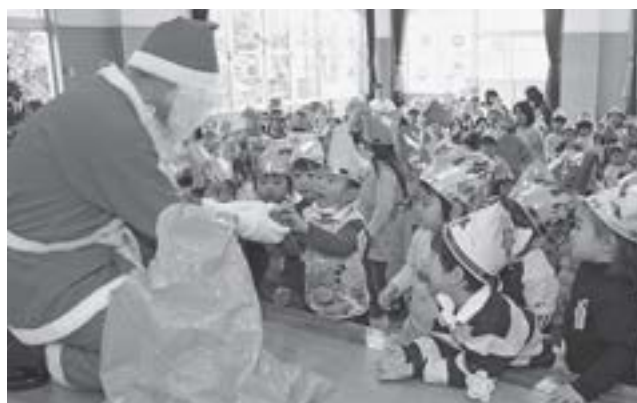
夜の森保育所クリスマス会(2007年12月撮影)