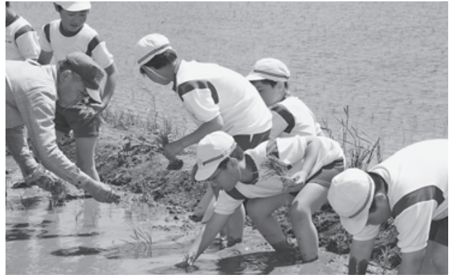
富岡第二小学校 (2008年5月撮影)