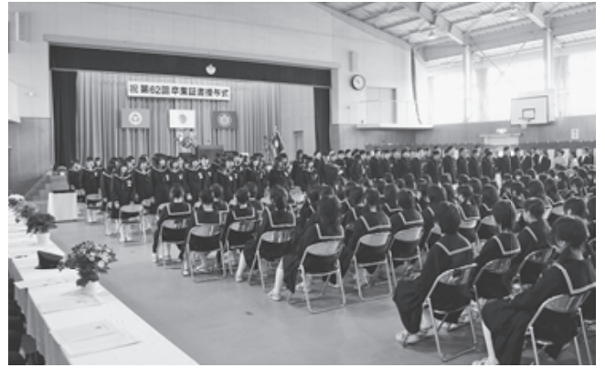
富岡第二中学校 (2009年3月撮影)