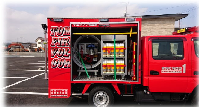
▶ 積載品 (ホース・鳶口等)