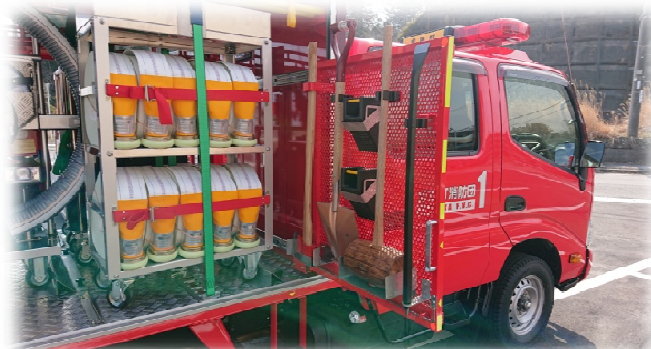
▲ 積載品 (カケヤ・金テコ等)