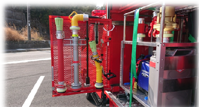
▲ 積載品 (管鎗・スタンドパイプ等)