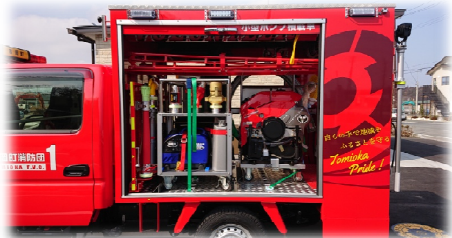
▲ 積載品 (発電機・ポンプ等)