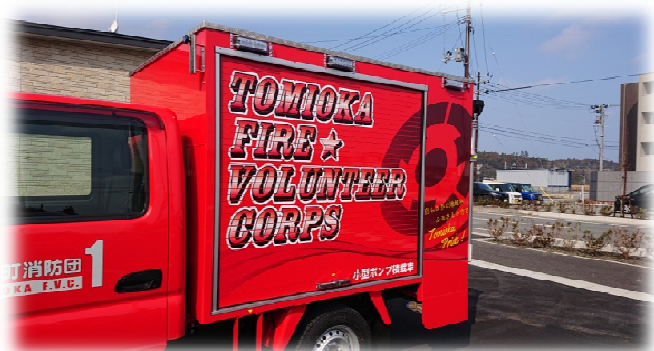
▲ シャッター (側面) デザイン