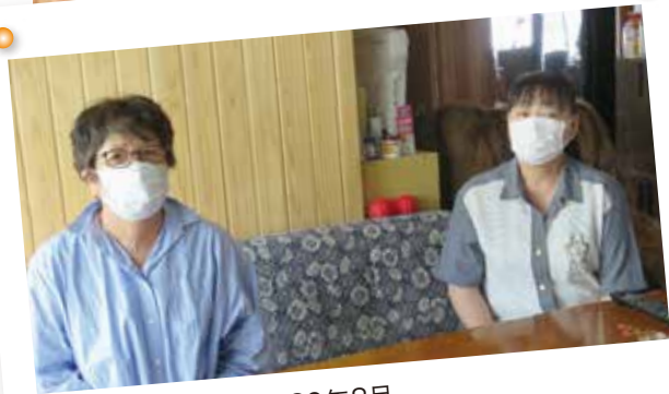
埼玉県(上尾市) / 2020年8月