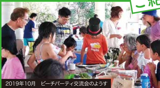
2019年10月 ビーチパーティ交流会のようす

福島と沖縄には古い縁があります。昔、いわき出身の僧侶が台風に遭い沖縄に漂着した際に、いわき地方の郷土芸能「じゃんがら念仏踊り」を伝承しました。これが現在のエイサーの起源だと伝えられています。