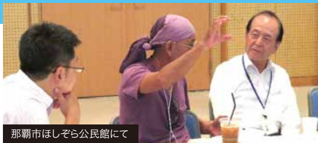
那覇市ほしぞら公民館にて

2019年9月22日、戸別訪問時に沖縄県で開催された福島県主催の「避難者相談・交流会」に参加いたしました。当日は、近況報告・健康チェック・癒しの“もみほぐし”・くらしの相談などが行われ、富岡町民の方や沖縄じゃんがら会の皆さんと交流を深めることができました。