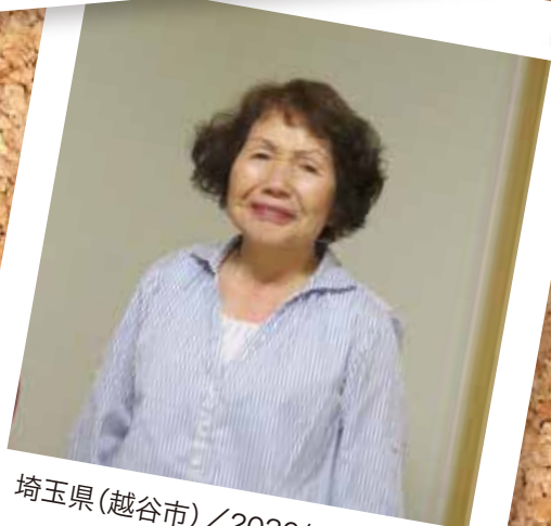
埼玉県(越谷市) / 2020年8月