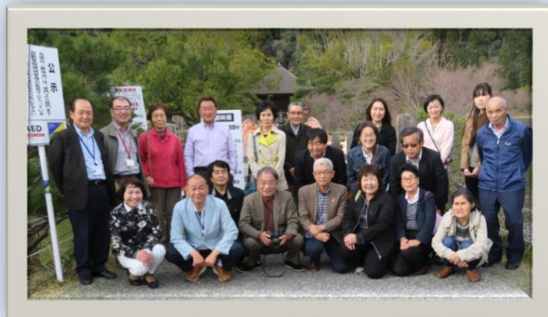
いわき市 白水阿弥陀堂にて