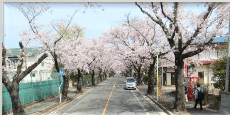
夜の森の桜 2016 4.9