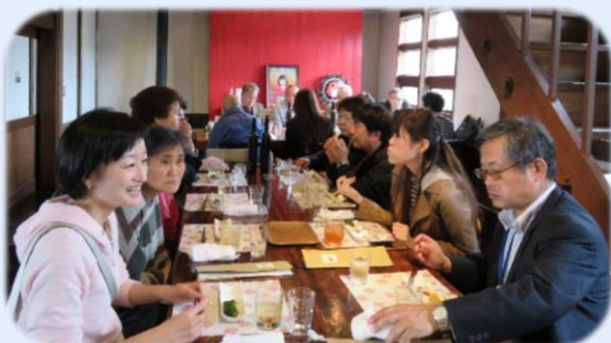
初日のランチは な嘉屋で十割の手打蕎麦！