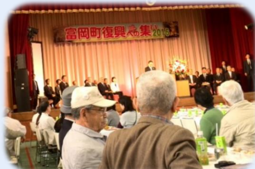
復興への集い…会場は再会の感激でいっぱい！

行ってきました！復興に賭ける町長の熱い想い、隣席の大臣に届いたでしょう。後ろ髪を引かれる思いで会場を後にしました。