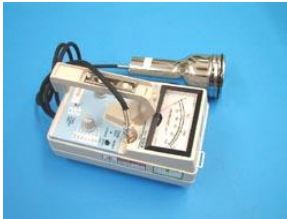
搬出物品等の汚染を計測