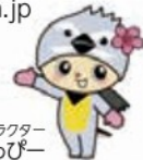
富岡町マスコットキャラクター とみっぴー

〒979-1192 福島県双葉郡富岡町大字本岡字王塚622-1 TEL.0240-22-2111 FAX.0240-22-0899 https://www.tomioka-town.jp