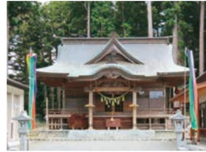
諏訪神社 本岡宇本町西223 0240-23-6267

大正12年から始まり、100年近く続いた伝統ある「えびす講市」。五穀豊穡と商売繁盛を祈念し、事代主神社の例大祭に合わせて開催していました。現在は、富岡町の秋の風物詩として続いています。