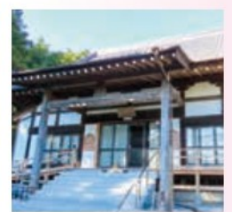
浄林寺 下郡山宇下郡26

国道6号線の陸前浜街道とJR東日本の常磐線の間にある。本堂へ向かう道筋の両脇に整然と並んだ白色の春日燈籠。訪れる人の感動を誘います。福島八十八ヶ所霊場の第44番札所。