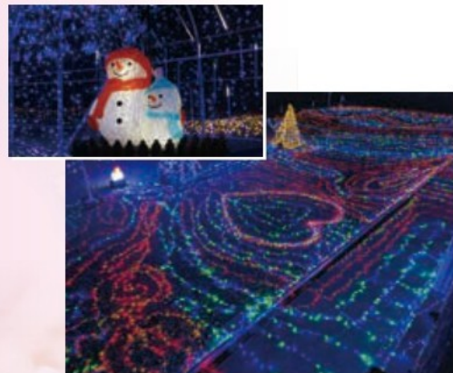
冬のイルミネーション

一部避難指示解除後毎年続く、人々が集い旧交を温める場。花火やイベントなどで、家族一緒に楽しめます。