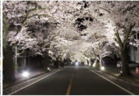
夜の森「桜のトンネル」

富岡町の「誇り」の桜のトンネル。樹齢80年以上の木も多く、始まりは明治時代の植樹に由来します。福島県を代表する桜の名所で、震災後も多くの方が訪れています。富岡駅から約4km、夜ノ森駅から約1km。全長2.2kmにわたり420本が植えられていて、樹種はソメイヨシノなどで夜の森地区全体で1,200本の桜があります。