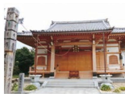
宝泉寺 本岡宇王塚451

山の頂に神の霊が宿るとして信仰されています。遠い昔から、夏は田の神となり、冬は山の神となって人々の生活を見守ってきました。8月15日には麓山の火祭りとして行われています。