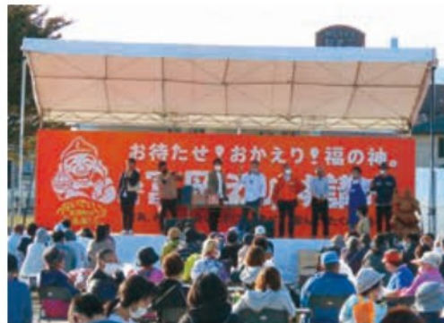
秋まつり「えびす講市」

令和2年から町のにぎわいが戻るようにと始まったイルミネーション。冬の風物詩として幻想的な景色に彩られます。