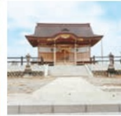
王塚神社 本岡宇王塚384-1

信濃国諏訪より奉遷されたといわれ、境内にある杉森は福島県の緑の文化財に指定されています。オリジナルの御朱印帳の販売もしています。