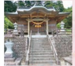
麓山神社 上手岡宇麓山2

子どもの守り刀の風習を持つ神社として信仰を集めています。豊作や子どもの健やかな成長を願い神楽が行われます。