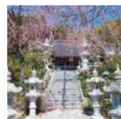
慈眼寺 上郡山宇太田473

福島八十八ヶ所霊場の43番札所。樹齢約900年 高さ12.5m 幹回り5m以上の枝垂れ紅桜は町の天然記念物に指定されています。