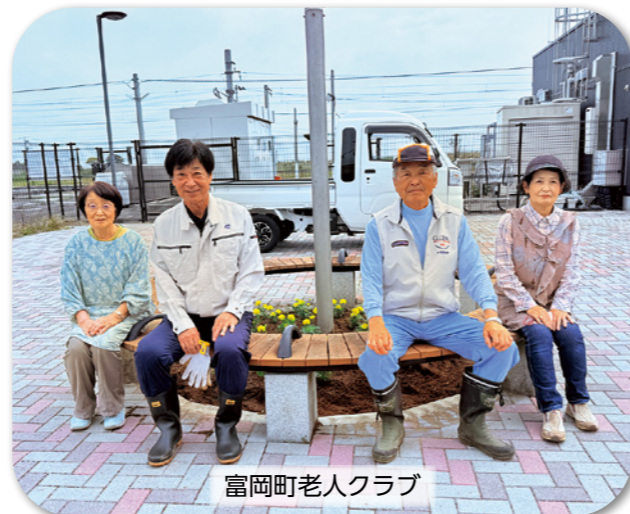
富岡町老人クラブ