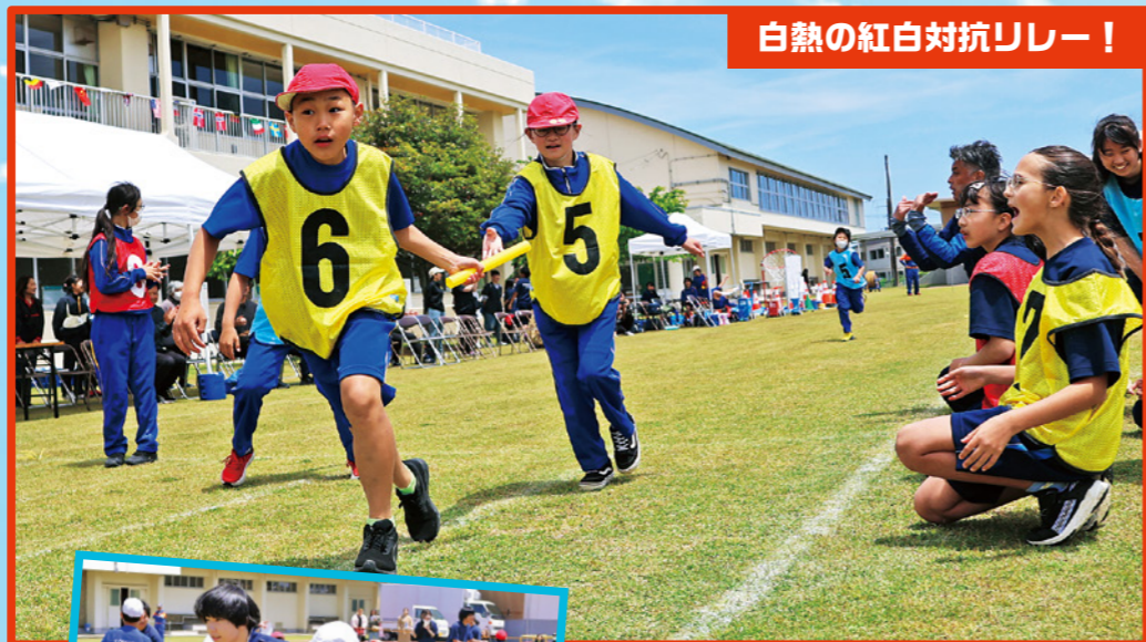
白熱の紅白対抗リレー！