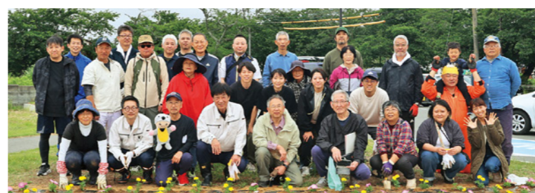
夜の森駅前南行政区・夜の森駅前北行政区・大菅行政区