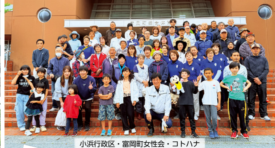
小浜行政区・富岡町女性会・コトハナ