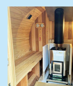
放熱設備(サウナストーブ)