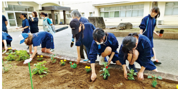
心を込めて花を植える児童生徒