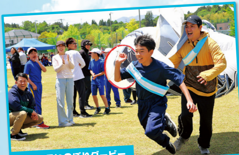
名物、こいのぼりダービー