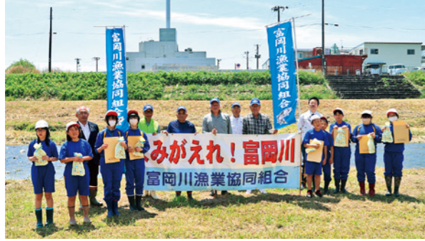
稚アユを放流した児童と富岡川漁協の皆さん