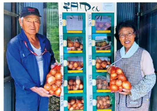
自宅の前でたまねぎを販売しています。ぜひ一度食べてみてください。

町は、作付推進品目の一つであるたまねぎ栽培を支援し、双葉郡の産地化に向けた取組を今後も後押ししていきます。