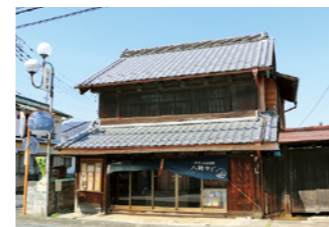
宿場町の面影を残す古民家をリノベーションした宿泊施設「八緒やど」

また、江戸と日光をつなぐ「日光街道」の宿場町として栄えた歴史も色濃く残っており、古き良き街並みの中に、温かい暮らしが続いています。