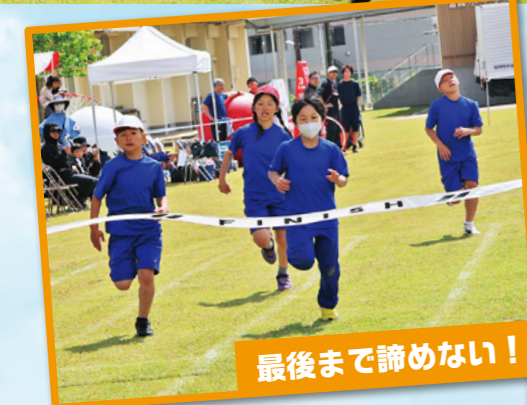
最後まで諦めない！