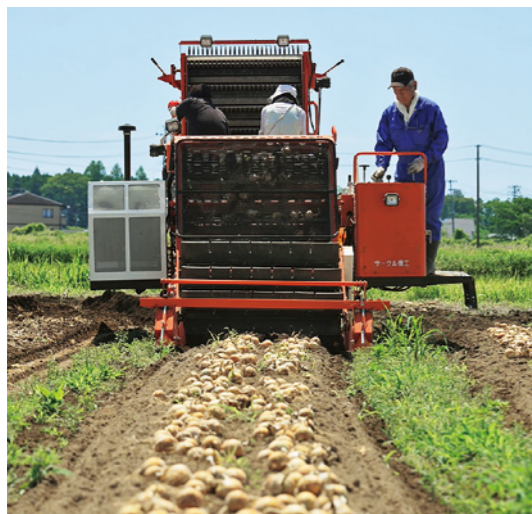
たまねぎの収穫作業の様子