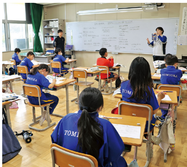
富岡に関する多くの質問が出された授業

「富岡町のことを詳しく聞いてみよう！」というテーマで行われた授業では、役場と町観光協会の職員が桜まつりの歴史やえびす講市、町の特産品などを紹介。児童からは桜のトンネルの長さやとみおかワイナリー、パッションフルーツの栽培方法など多くの質問が出され、「古里富岡」を知る貴重な時間となりました。また、昭和初期に行われた桜まつりの映像も流され、その時代背景に児童たちは興味津々の様子で見入っていました。