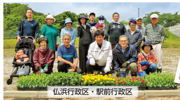
仏浜行政区・駅前行政区