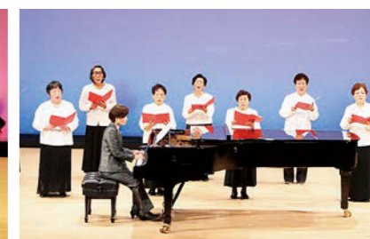
富岡町楽しくうたう会