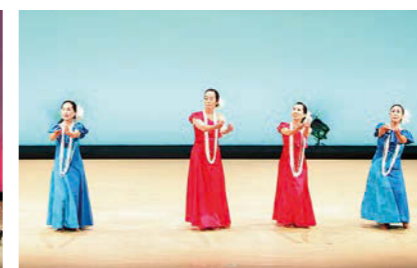
めぐみフラスタジオ