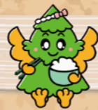
杉戸町マスコットキャラクター すぎびよん

杉戸町は、埼玉県東部に位置する人口約45,000人の町で、江戸時代は日光街道の宿場町として栄えました。平成22年に富岡町と友好都市協定を締結し、交流が続いています。