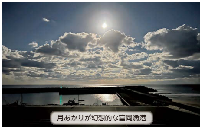
月あかりが幻想的な富岡漁港