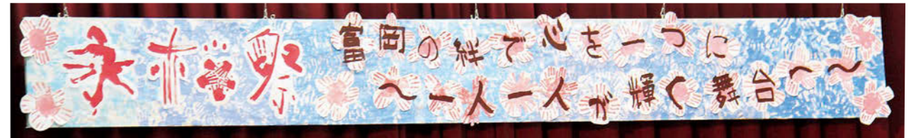
ステージに掲げられた児童生徒手作りの横看板。文字のバックは子どもたちの手形で彩られています。

学習発表を終えた6年生の男子児童は「みんなで協力しあいながら練習や準備を行ってきました。少し緊張しましたが、楽しく演技することができました」と笑顔で話してくれました。