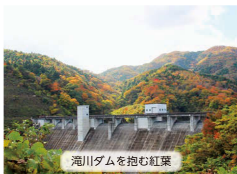
滝川ダムを抱む紅葉