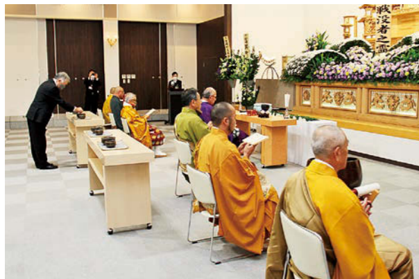
ご焼香し祈りを捧げること遺族