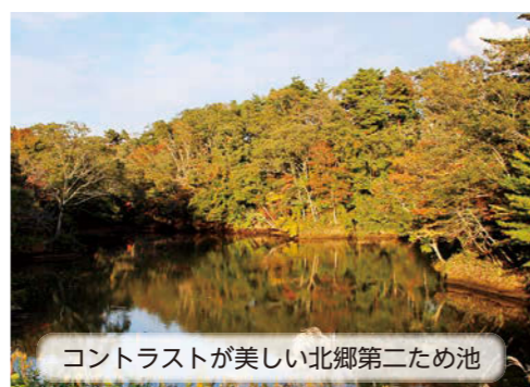
コントラストが美しい北郷第二ため池