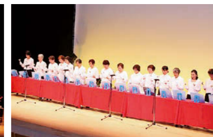
永崎女性の会ハンドベル