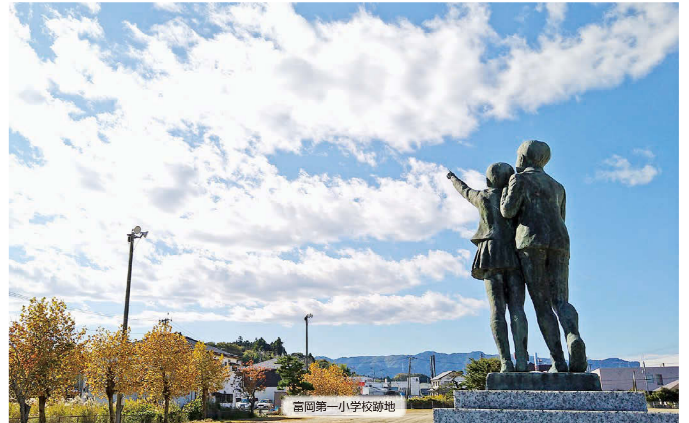
富岡第一小学校跡地