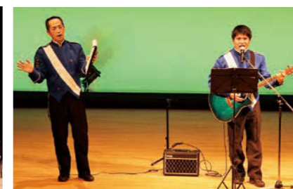
福島県警ギターポリス