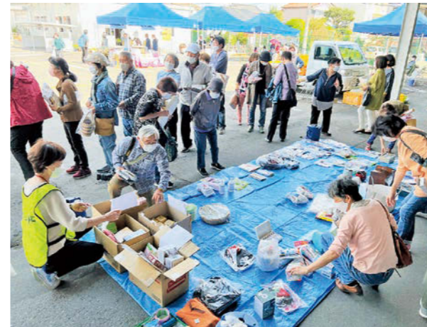
多くの来場者で賑わったバザー

10月15日、富岡町役場いわき支所内で「とみおか・いわきふれあいフェスタ2022」を初めて開催しました。 会場を訪れた約400人は、作品展を鑑賞したり、特産品・農産物の買い物したり、園芸やエコクラフトのワークショップに参加するなど、思いの楽しみ方で催しを満喫しました。 各ご家庭から持ち寄られた日用雑貨品が並ぶバザーでは、販売開始前から多くの来場者が掘り出し物を求めて行列をつくり大盛況となりました。