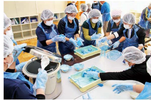
おにぎりを作る参加者の皆さん