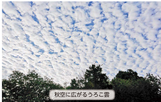
秋空に広がるうろこ雲