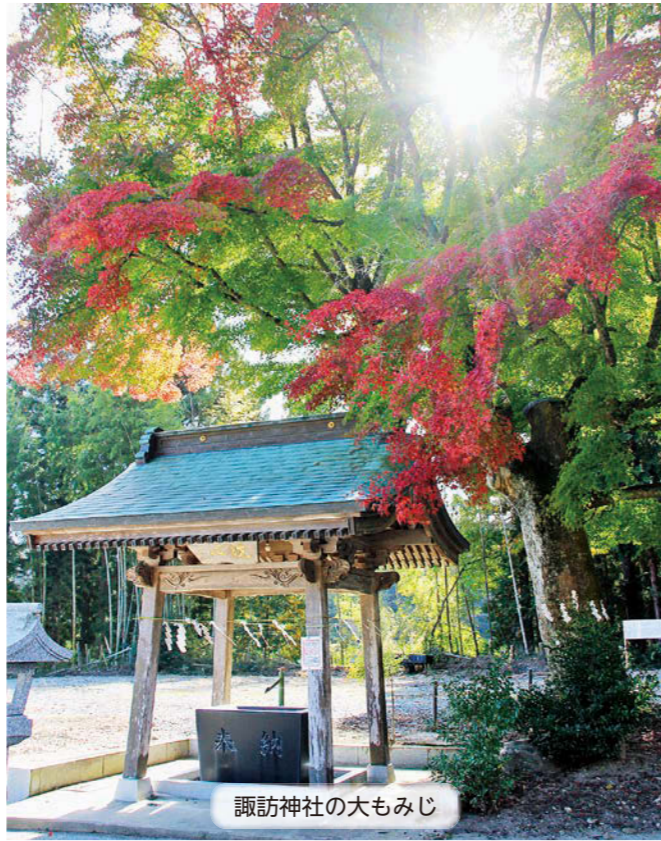
諏訪神社の大もみじ