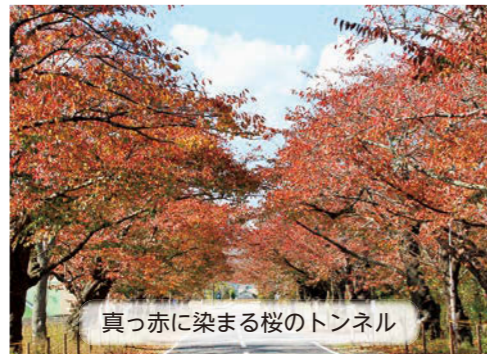
真っ赤に染まる桜のトンネル

問 企画課 広聴広報係 ✉ tom0200-006@tomioaka-town.jp