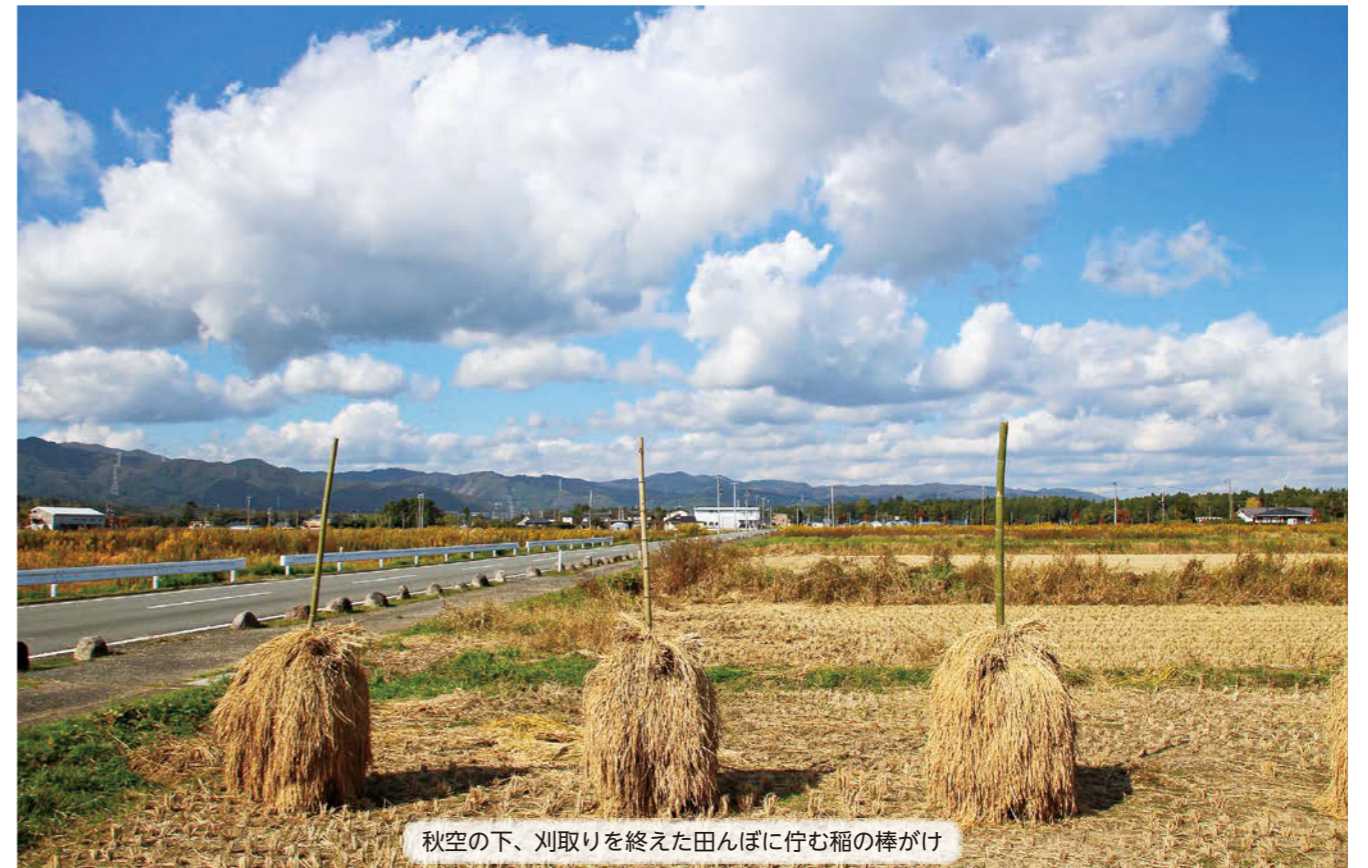
秋空の下、刈取りを終えた田んぼに佇む稲の棒がけ