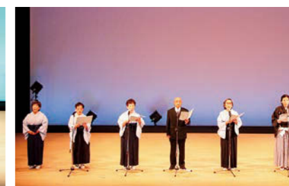
天山流吟剣詩舞道富岡支部