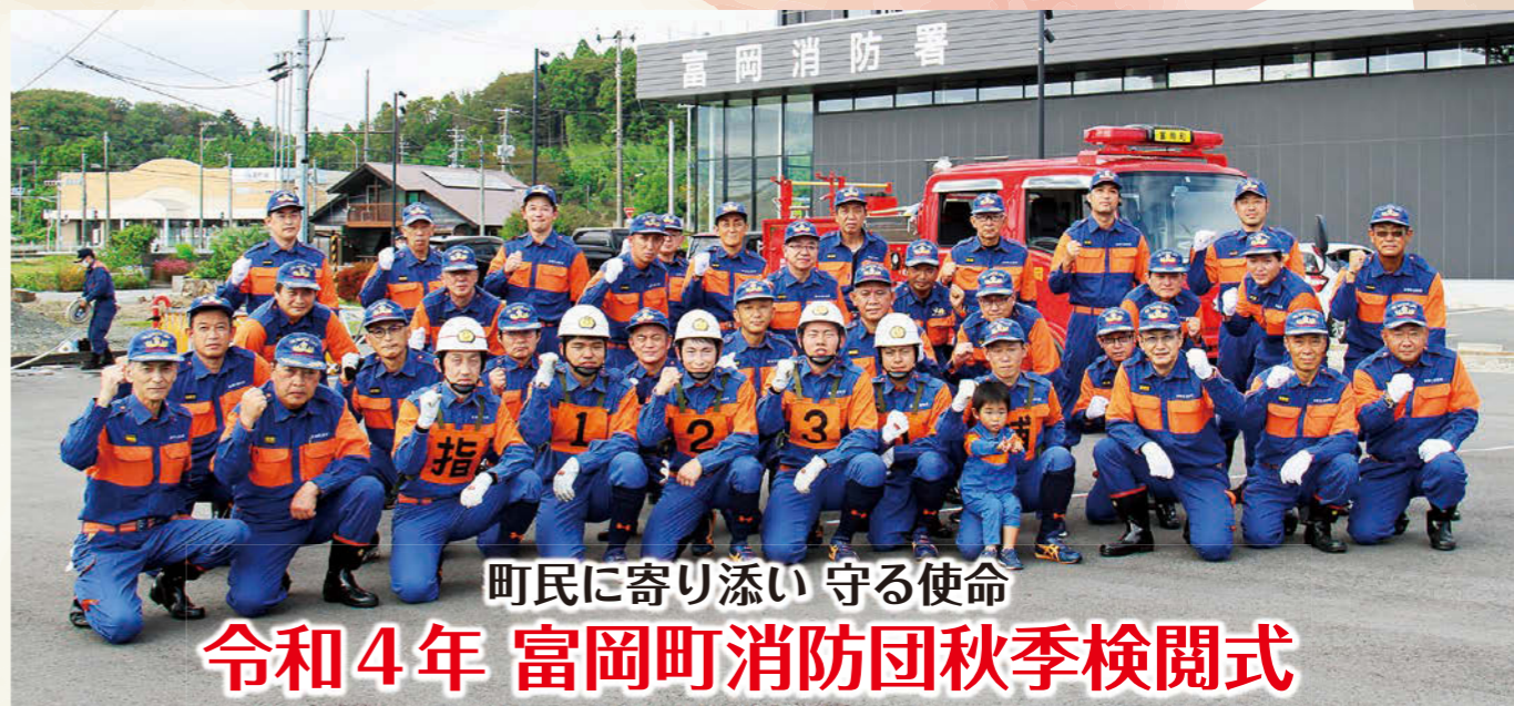
町民に寄り添い 守る使命 令和4年 富岡町消防団秋季検閲式

第29回全国消防操法大会が、10月29日、千葉県消防学校(市原市)で開催され、福島県代表として「ポンプ車操法の部」に出場した富岡町消防団は、全21チーム中12位という成績を収めました。