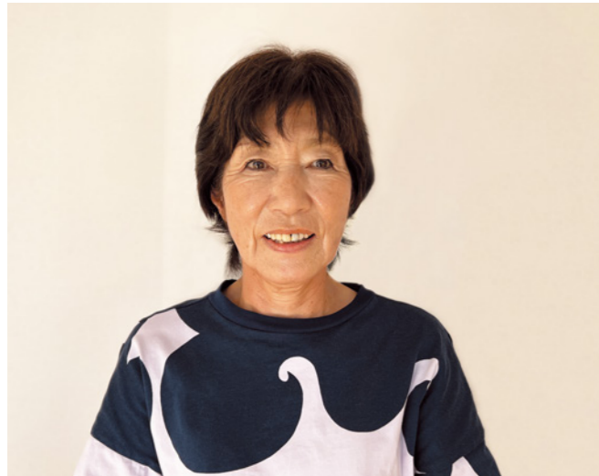
スポーツジムが生きがいのひとつになりました。