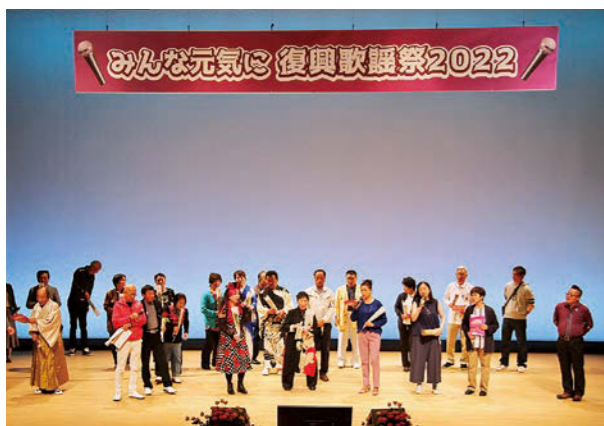
フィナーレは全員で「ハナミズキ」を合唱