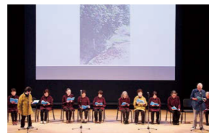
富岡町大人の音読教室