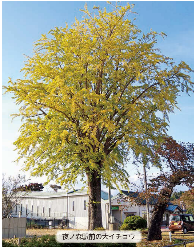
夜ノ森駅前の大イチョウ