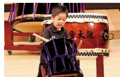
さくら YOSAKOI 天花