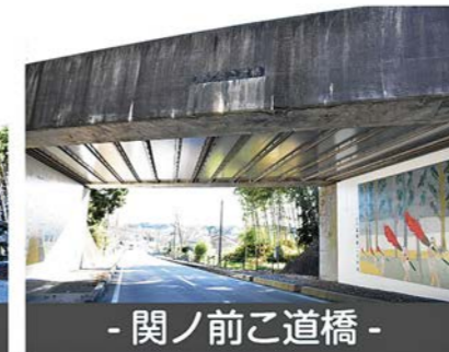
- 関ノ前こ道橋 -