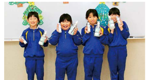
「どうもありがとうございました！」と笑顔の小学生

ジェルは、町立小中学校のほか町内の公共施設に設置し、新型コロナウイルス感染症対策に使用させていただきます。