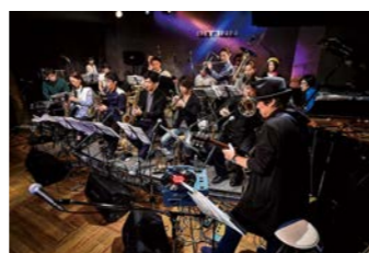
富岡町生涯学習課 生涯学習係