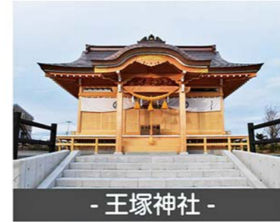
- 王塚神社 -