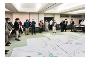
担い手座談会後の営農計画図面を見渡す営農者

★「営農者」と「農地を貸したい方」のマッチングの申し込みや、農地・農業に関するご相談は、町産業振興課やJA福島さくら、県双葉農業普及所などに、お気軽にお問い合わせください。