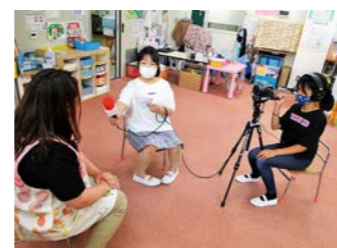
富岡町生涯学習課 生涯学習係