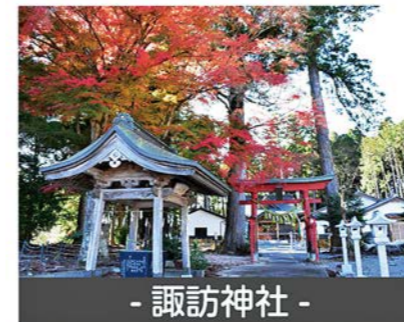
- 諏訪神社 -

コミュニティ広場の「町の様子」では、スタッフが撮影した町内の様子を定期的に配信しています。皆さんも「町内のお気に入りのスポット」を撮影して、ぜひ投稿してみてください♪また、「町のここが見たい」などの要望がございましたら、「コミュニティ広場>町の様子>ご意見・ご要望」までコメントください♪