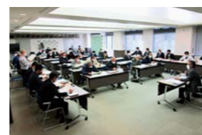
意見交換会の様子

➡基盤整備事業では条件が一致する場合の区画拡大や暗渠(あんきょ)の新設・変更などを実施中です。国の交付金を財源としているため、この場で来年度実施可能とは言えないことをご理解願います。また、多くのメニューがある県の営農再開支援事業でできることもありますので、引き続きご相談ください。