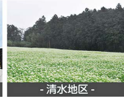
- 清水地区 -