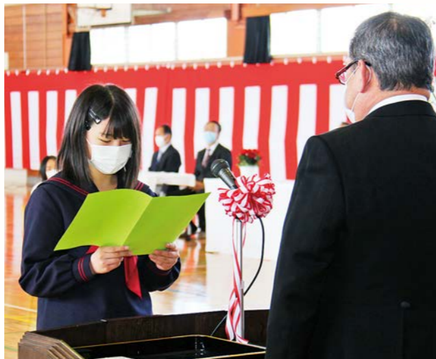
誓いの言葉を述べる中学生