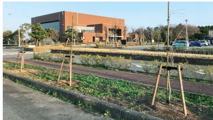
場内に植えられたしだれ桜