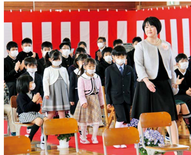
在校生の拍手に迎えられ入場する新入生

小中学校の新入生は、富岡校と三春校合わせて8人。少し緊張し一中の男子生徒による歓迎のことばを真剣なまなざしで聞きながら、