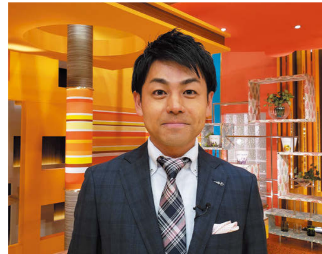
現場主義！スタジオには放送ギリギリに入ります

現在は平日夕方方のニュース番組「ゴジてれChu!」でキャスターを務めています。ニュースは新型コロナウイルス一色です。恐らくこの桜通信が掲載される時も収束には程遠い状況だと思えます。どうかお体を大事にしてください。そして、来年こそ、桜のトンネルの下にたくさんの方々が戻ることを祈っています。