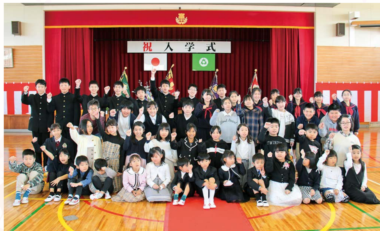
チームワークと元気の良さは日本一！笑顔いっぱいの児童、生徒たち