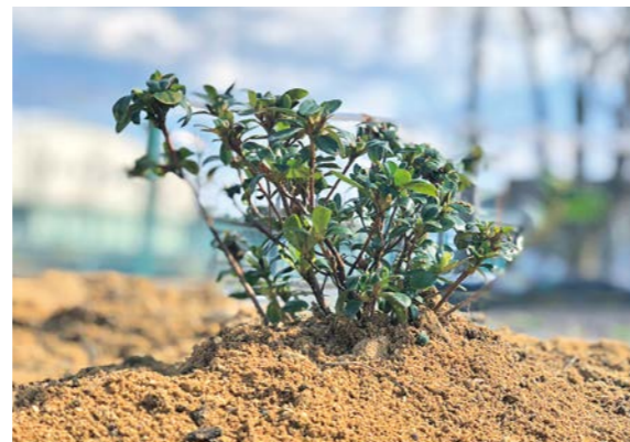
職員がサツキを植えました

プロジェクトで植栽予定だったピオラを植えました。 また、スポーツ交流館跡地に建設した防災備蓄拠点倉庫前には、しだれ桜の苗木も植えましたので、皆さまお越しの際は、ぜひご覧ください。