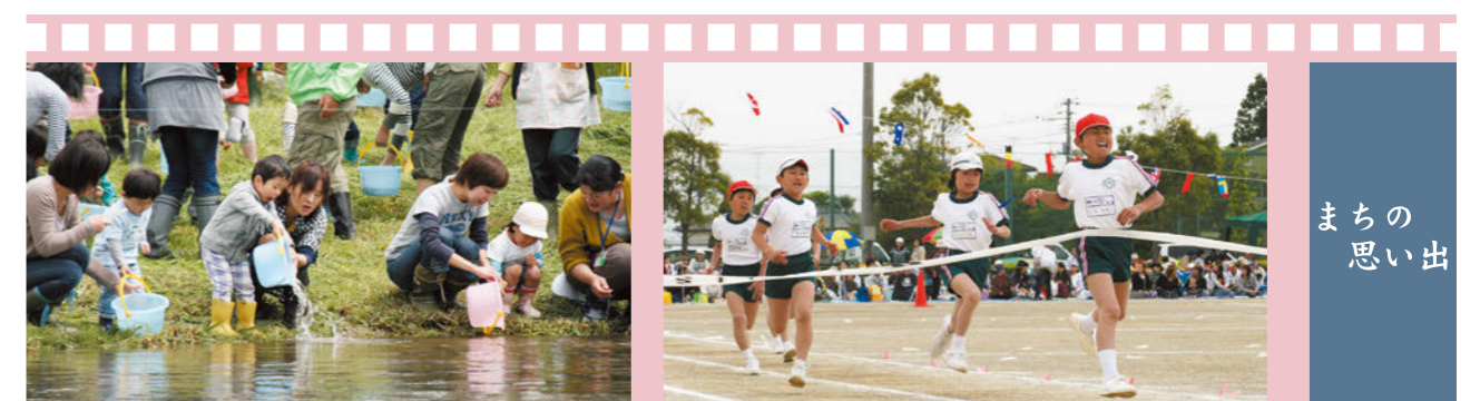
ま ち の 思 い 出