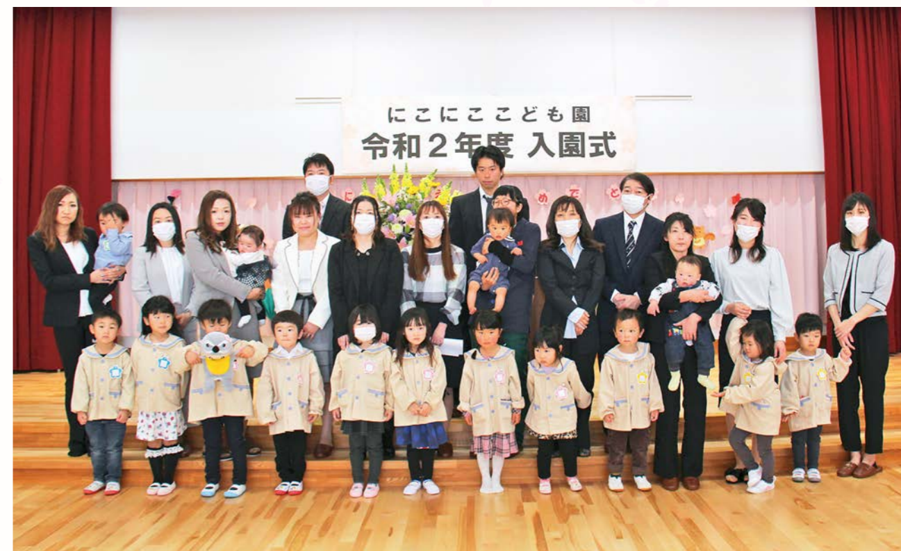
元気に遊んで友だちいっぱい作ろうね！