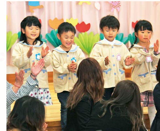
式の最後に元気よく「幸せなら手をたたこう」を合唱