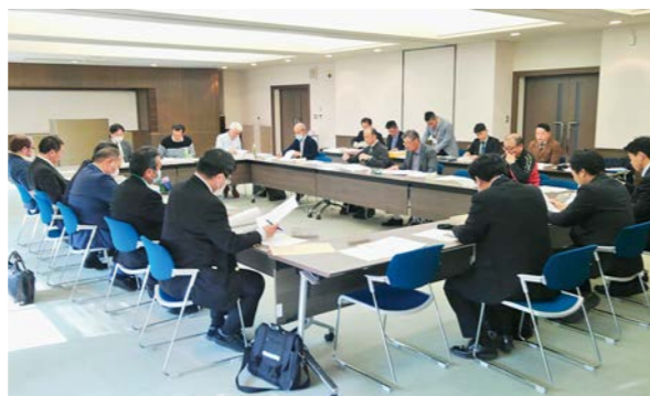
3月26日に開催された「富岡町農業連携推進協議会」