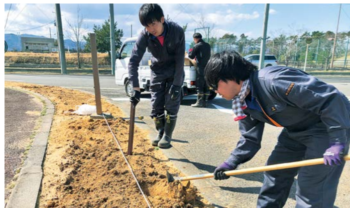
職員総出での作業

新型コロナウイルス感染予防のため、3月中の体操教室とイベントが全て中止となりましたが、この時間を利用して総合運動場や下郡山運動場、スポーツセンター内の整備・植栽作業を行いました。 スポーツセンター内の花壇には、サツキや3月に実施し「花と緑のスポーツセンター復興プ