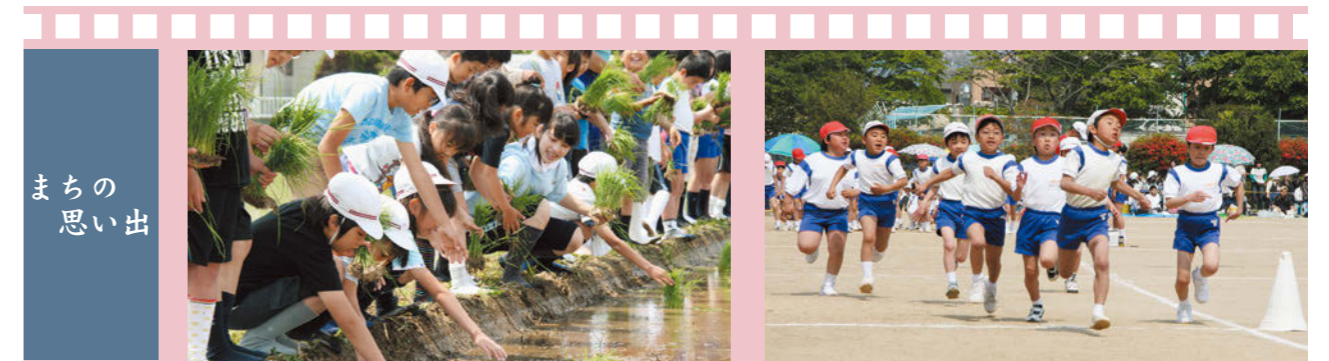
ま ち の 思 い 出

この「TOMIOKA（とみおか）桜通信」は、避難生活を続ける皆さんや、富岡町にゆかりのある方々のもとを訪ね、皆さんの声をお届けし、ふるさと「富岡」という「絆」をつないでいこうというものです。