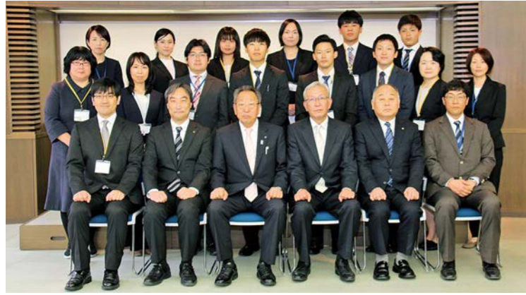
着任された先生方。前列右から3人目は岩崎教育長