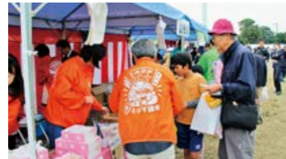
富岡町産の商品をPRする商工会(左)と産業振興課