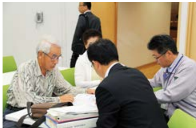
閉会後の個別相談

町の現状や重要施策を説明し、町民の皆さまと意見交換を行う町政懇談会を、10月12日に東京都、17日に富岡町、19日にいわき市、20日に郡山市で開催しました。懇談会には、4会場で町民など95人が参加。町の重要施策や復興の現状を説明したあと意見交換が行われ、参加者からは新しい居住者を迎えるための町の方針や鳥獣被害対策、また、避難先で台風19号の被害を受けた町民に対する支援について