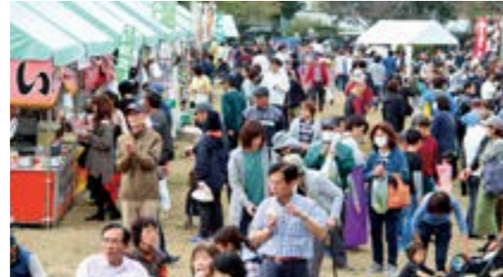
多くの人で賑わったイベント会場