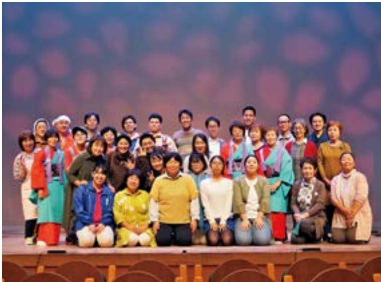
今年1月の富岡公演に続き、東京公演でも観客に感動を届けた出演者の皆さん

10月29日、東京代々木の国立オリンピック記念青少年総合センター小ホールで、富岡町民劇「ホーム～おばあちゃんが帰る日～」を上演しました。