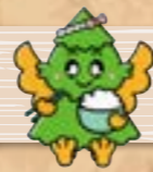
杉戸町マスコットキャラクター すぎびよん

杉戸町は、埼玉県東部に位置する人口約45,000人の町で、江戸時代は日光街道の宿場町として栄えました。平成22年に富岡町と友好都市協定を締結し、交流が続いています。