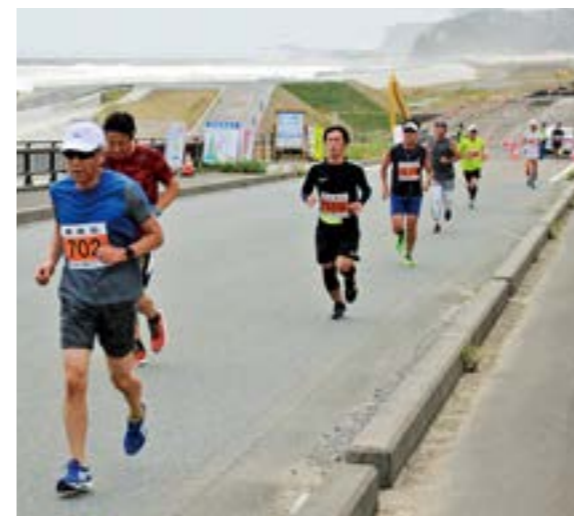
海岸を見ながら子安橋を走るランナー