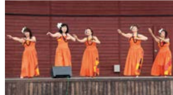
優雅な踊りを見せる杉戸町のフラダンスチーム

秋晴れが広がった11月3日、埼玉県杉戸町のアグリパークゆめすぎとで、「第31回杉戸町産業祭」が行われました。会場には、地元農産物の展示即売や地元業者によるブースが多数並び、昨年に続き富岡町商工会と町産業振興課が富岡町産の米や野菜、米粉を使用したパームクーヘンなどを販売しました。また、ステージではフラダンスや子どもたちによるパフォーマンス、歌謡ショーなどが行われ、大きな盛り上がりを見せました。