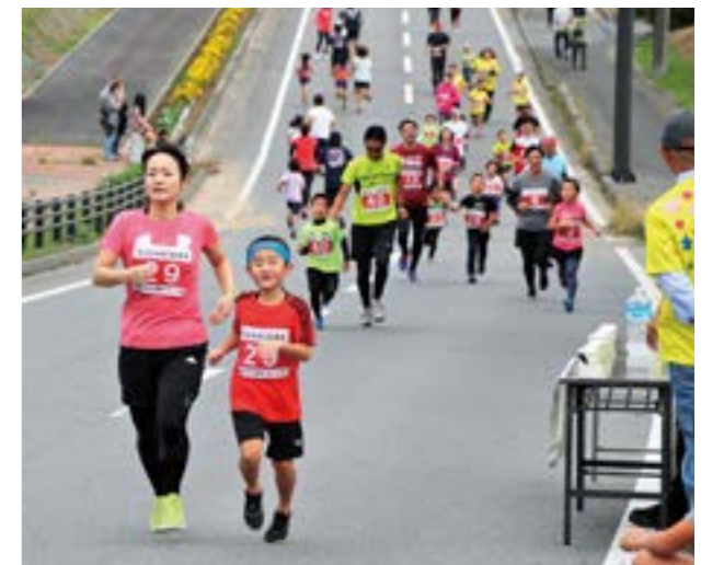
ゴールはもうすぐ！（親子の部）