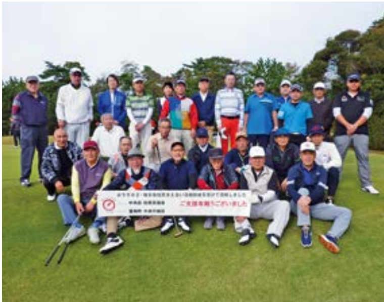
ゴルフで親睦と絆を深めた参加者の皆さん

中央行政区は、11月3日に震災後2回目となる区民ゴルフ大会を、小名浜カントリークラブで開催しました。