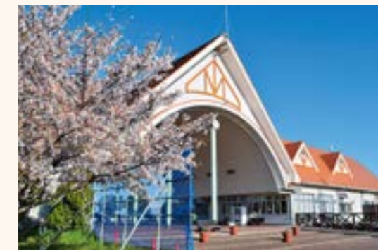
直売所や食堂などが入る本館棟

紹介!! 「アグリパークゆめすぎと」は、遊具や広大な芝生広場、バーベキュースペースなど充実した施設が魅力の道の駅です。 地元産の新鮮野菜が購入できる直売所や収穫体験など、毎月様々なイベントが開催され、家族で1日楽しめます。 ▼住所…埼玉県北葛飾郡杉戸町大字才羽823の2 ▼定休日…第1・第3水曜日(祝日の場合は営業) 年末年始