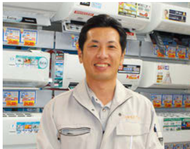
電気のことならお気軽に！

無店舗からの再出発 親戚を頼り千葉県に避難してから約8か月後、福島県内に戻りました。いわき市での営業再開に不安はありましたが、電器屋の自分に何かできることはないかと考え「家電のお困り事はありませんか？」という御用聞きチラシを作り、いわき市内の仮設住宅を二世帯ずつ回りました。電球の交換から電化製品の使い方に至るまで、久々に顔を合わせた富岡町民を