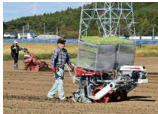
初めての事業として行った玉ねぎの作付け

「後継者を育成し、農地の保全と有効活用、そして農業の再生と発展のために頑張っていきたい」と話され、今後は露地野菜と水稲の複合経営、また、帰還できない農業者が所有する農地を集積した営農などに取り組みます。町内では今年、1団体6農家が水稲、2団体3農家が畑作や花の栽培、さらに1団体が富岡産ワイの醸造をめざし葡萄の収穫を行うなど、町の基幹産業である農業復活へ向けた動きが活発化しています。