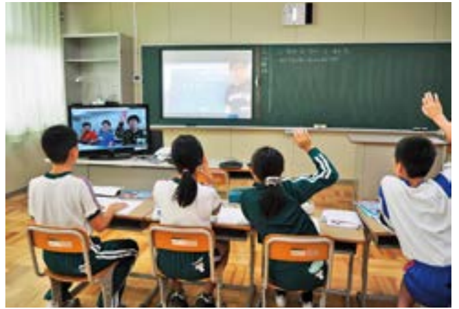
富岡校と三春校のテレビによるライブ授業