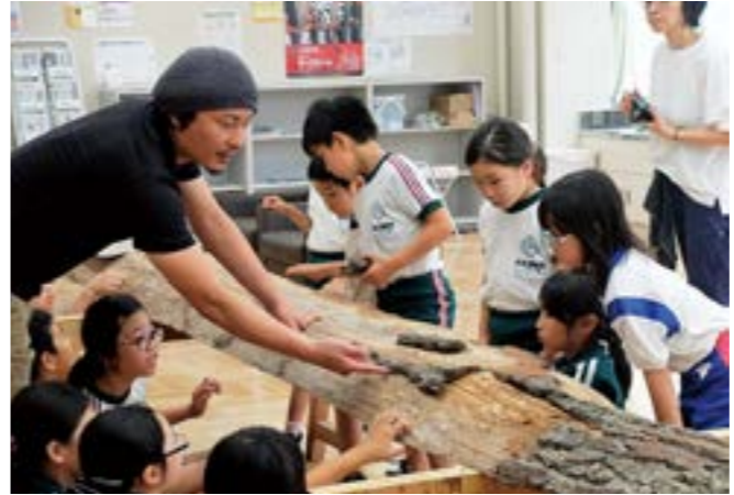
いろいろな分野のプロを招いての授業