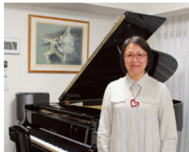
音楽に「親しみ・楽しむ」ひと時を

商品の配送・設置・施工など、私たちと一緒に働いていただける方を募集しています。お気軽にご連絡ください。