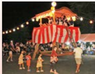
火祭りの余韻の中で行われた盆踊り