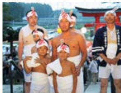
伝統を親から子へ

五穀豊穡を願い400年の歴史を誇る伝統行事「麓山の火祭り」が8月15日、杉内の麓山神社で行われました。 県の重要無形民俗文化財である火祭りは、昨年震災から8年ぶりに復活し今年も地元の若者など約40人が参加。台風10号の影響で時折り小雨が降る中、燃え盛る大たいまつを担ぎ「千灯（せんだう）、千灯」の掛け声とともに麓山の参道を駆け上がりました。 また、親子で参加する姿も見られ、父親に見守られながら一生懸命たいまつを担ぐ子どもの姿に、詰めかけた観衆から大きな拍手が送られていました。