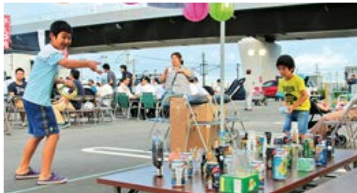
子どもたちは輪投げに夢中