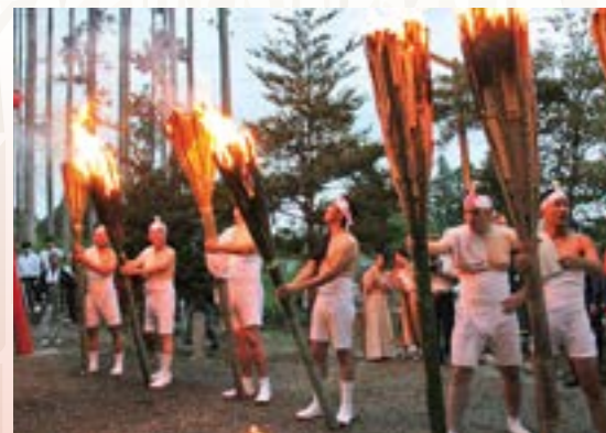
辺りを赤く染めるたいまつ炎

五穀豊穡を願い400年の歴史を誇る伝統行事「麓山の火祭り」が8月15日、杉内の麓山神社で行われました。 県の重要無形民俗文化財である火祭りは、昨年震災から8年ぶりに復活し今年も地元の若者など約40人が参加。台風10号の影響で時折り小雨が降る中、燃え盛る大たいまつを担ぎ「千灯（せんだう）、千灯」の掛け声とともに麓山の参道を駆け上がりました。 また、親子で参加する姿も見られ、父親に見守られながら一生懸命たいまつを担ぐ子どもの姿に、詰めかけた観衆から大きな拍手が送られていました。