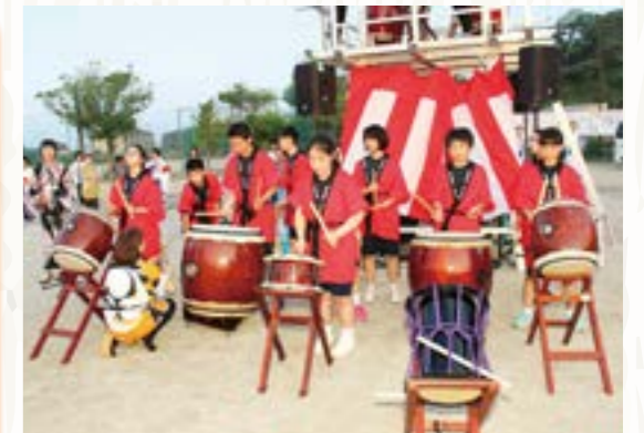
見事なバチさばきを見せた中学生

梅雨明け直後の8月2日、富岡夏祭り2019が富岡第一小学校校庭で行われ、700人を超える来場者がふるさとの夏を満喫しました。 震災前は「うちわ祭り」の愛称で親しまれてきた伝統の富岡夏祭り。今年からは、従来のお盆期間中から前倒ししての開催ということもあり、地域で働く皆さんの姿も多く見られました。 祭りは、中学生による勇壮な太鼓演奏でスタート。盆踊りが始まる頃から空が茜色に染まり始め、揃いの浴衣やハッピを来た皆さんなど多くの参加者が二重三重にやぐらを囲み、浜風に吹かれながら華やかな踊りの輪をつくりました。