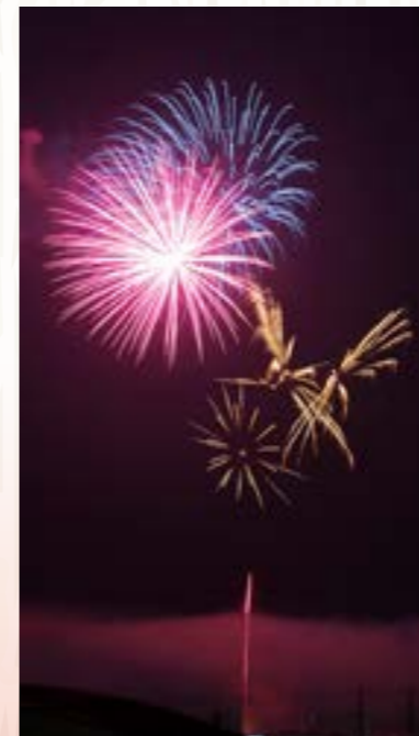
フィナーレを飾った花火