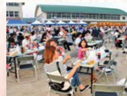
富岡の夏を楽しむ多くの来場者