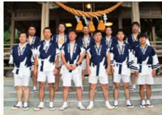
祭りを支えるはやま青年会の皆さん