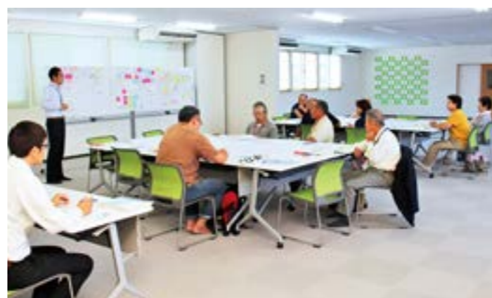
町民による意見交換会(いわき会場)

特定復興再生拠点区域では、令和5年の避難指示解除を目指して復旧作業が進められていますが、この日参加した町民からは、夜ノ森駅前への情報発信スペース設置の重要性など、様々な視点からの意見が出されました。