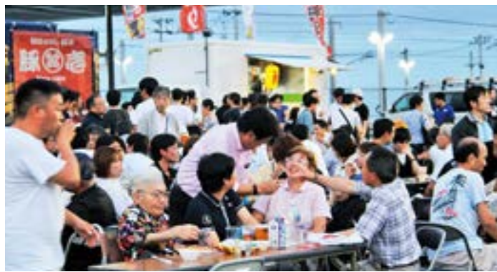
富岡の夏を満喫する来場者

会場を訪れた人たちは、「震災前にここで行われていたお祭りを思い出しました。こんなにたくさんの人に来てもらっても嬉しいです」「これだけ暑いとビールが美味い！活気があったて最高です」と、暑い富岡の夜を楽しんでいました。