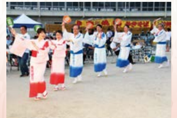
揃いの浴衣で華やかに