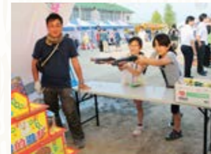
懐かしい射的に夢中の小学生