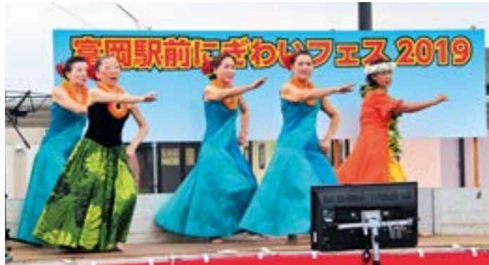
華麗なフラダンスによるステージ