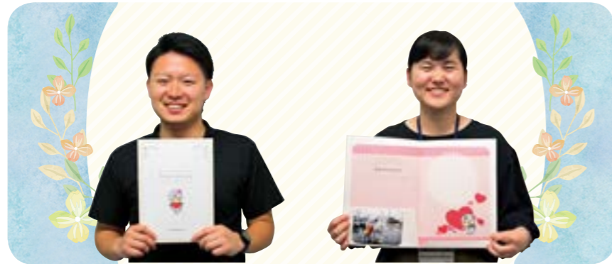
専用台紙(左)と受理証明書(右)

また、本証明書と併せて作成した専用台紙は、写真を入れて二人の思い出と一緒に飾ることができます。なお、数に限りがあるため無くなり次第終了となります。