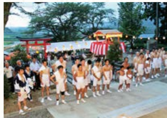
神事に臨む参加者