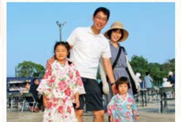
親子で夏の思い出づくり