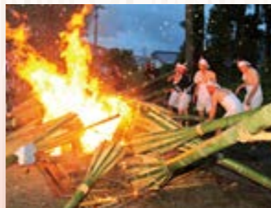
燃え盛る浄火をたいまつに