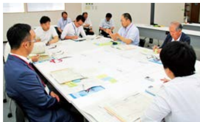
第二次災害復興計画についての意見交換会(郡山会場)