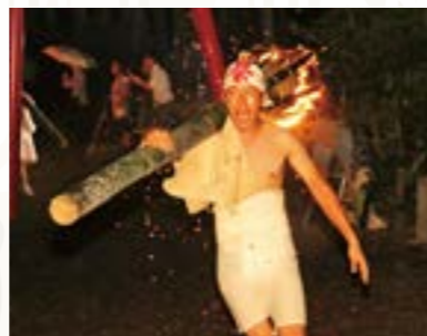
火の粉を物ともしない気迫