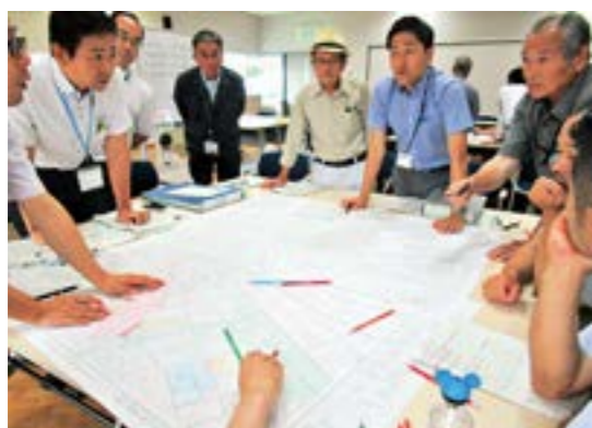
営農再開へ活発な意見が出された担い手座談会