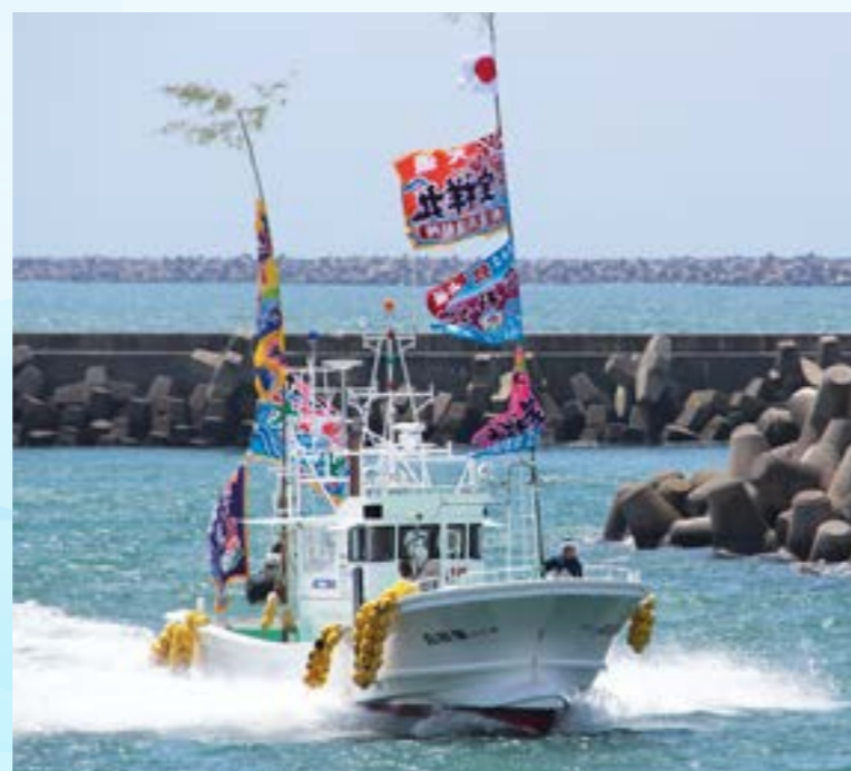
大漁旗を掲げ港に入る漁船