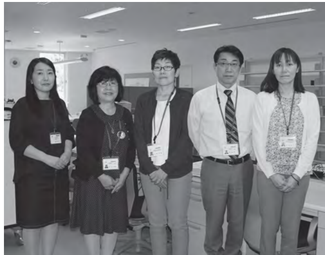
地域医療を通して復興のお手伝いさせていただきます

地元本位の施設に向けて 今年4月から準備室を設け、開院に向けた本格的な準備作業を行っています。スタッフの半数以上は、震災前まで双葉郡内の医療機関に勤務していました。 震災前、富岡町をはじめ双葉郡内には、手術や入院機能を持つ拠点病院は4つありましたが、避難指示で全て閉鎖となっていました。東