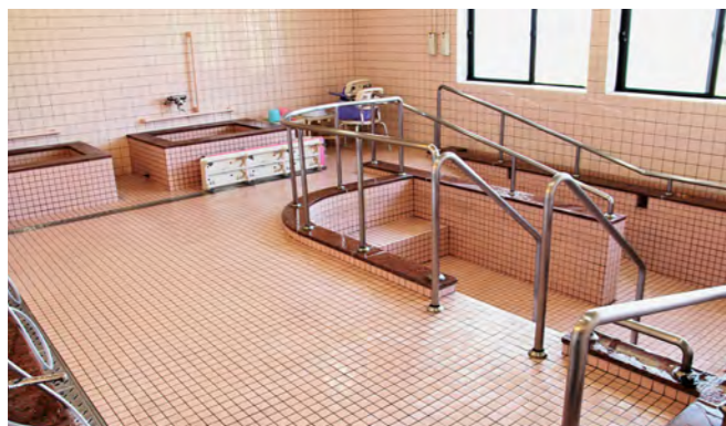
機械浴室と一般浴室を備える「もとまちの湯」