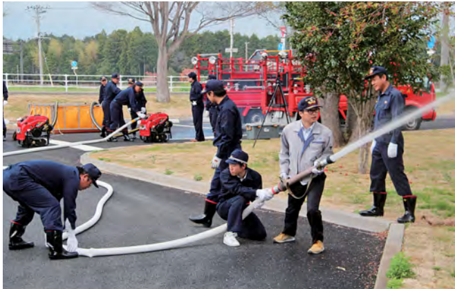
放水訓練を行う役場班

富岡町役場に勤務する職員数名を中心に、緊急時対応の迅速化を目的として、富岡町役場消防団「役場班」を組織しました。