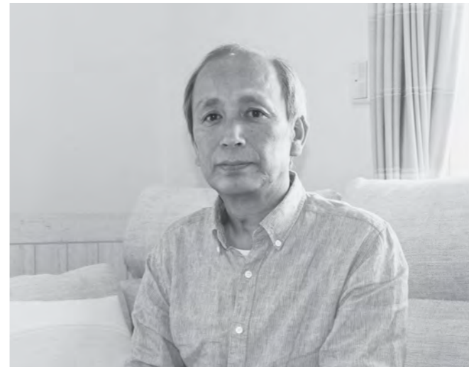
町の復興を見届けるためにも帰還を予定しています

田地区が復興拠点として整備されることが決まったときには、胸の奥からこみ上げるものがありました。しかし、間もなく定年を迎える身として自ら率先して携わることが難しく、心残りではありましたが後輩の皆さんにバトンを渡し将来を託して、41年間お世話になった町職員生活にピリオドを打たせていただきました。