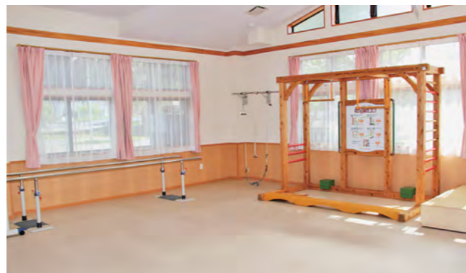
ダイフロアに併設された「うんどう楽園」