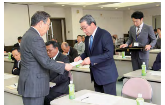
委嘱状の交付を受ける行政区長（中央）