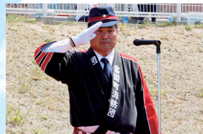
富岡町消防団の指揮をとる猪狩団長