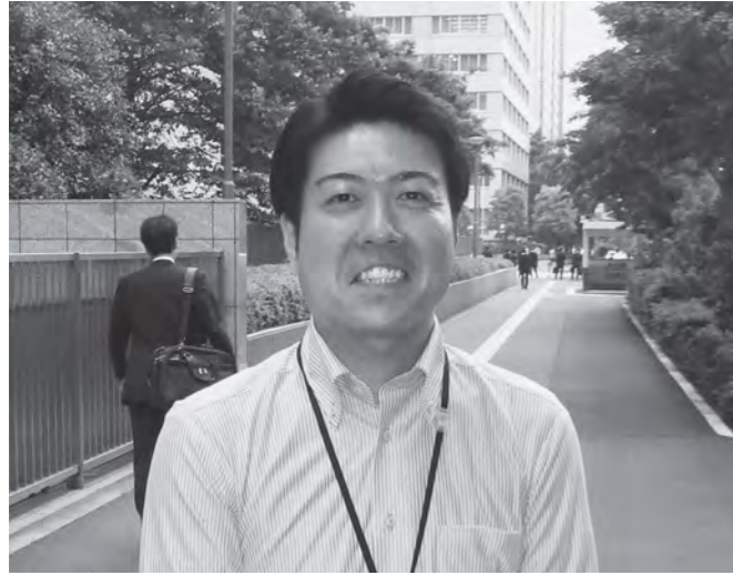
機会があれば再び富岡町で仕事をしたいと思います

秋田県湯沢市出身。経済産業省職員で、原発被災自治体支援のため2年間、富岡町に派遣され現場業務に従事した。帰任後も、町関係者との交流や、町に足を運ぶなど、当町への思いを寄せ続けている。 海外で知った震災の惨禍 平成11年、通商産業省(当時)に入省し、アメリカ合衆国への派遣中に東日本大震災が発生しました。大地震、大津波、そして原発事故など、現地メディアでも東北地方を中心に未曾有の惨禍となった様子が伝えられているにも関わらず、日本国公務員そ