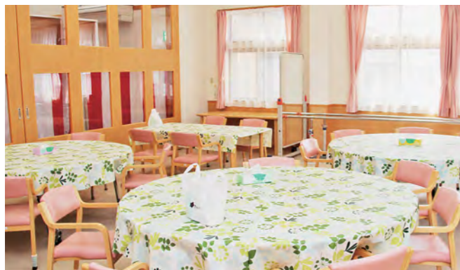
カラオケなど楽しく過ごせるダイフロア