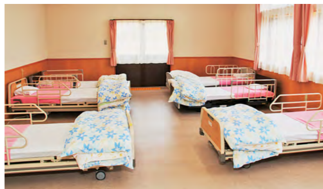
横になってゆっくり休める静養室