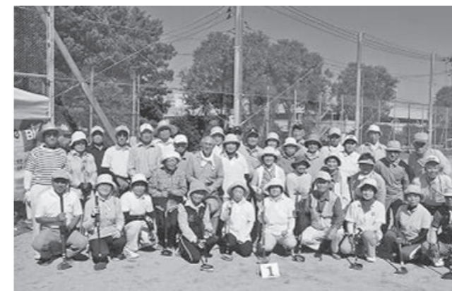
交流を深めた参加者の皆さん(いわき会場で)

いわき会場に参加した地元の愛好者は「避難生活は大変だと思うが、健康のためにも愛好者同士、これからも一緒に仲良くプレーして交流していきたい」と語られ、富岡町のグラウンド・ゴルファーにエールを送りました。