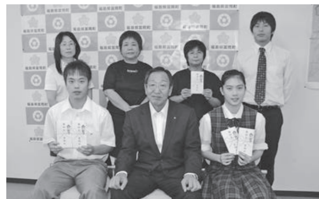
大舞台での活躍を誓ったドリーム富岡(後列左から3人)と富岡高校バドミントン部の皆さん