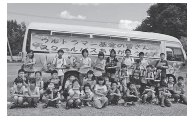
待ちに待ったバスの前でポーズをとる児童たち

ンは福島県が育てたヒーローです。これからも勉強と遊びに励み、皆さんの希望と笑顔をバスに乗せてください」とあいさつ。子どもたちは、車体に描かれた憧れのウルトラ兄弟に目を輝かせながら笑顔でバスに乗り込んでいました。