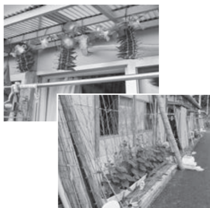
軒下を彩る収穫物やプランター (左上・とうがらし、右下・きゅうり)

現在、被災前まで同じ町内に生活していた家族は、学校や仕事の都合で離れて暮らしています。特に、南