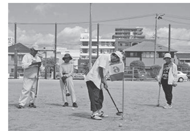
気の合った仲間とのプレーは最高ですね

大会はいわき市2会場のほか、郡山市、大玉村、三春町で行われ、県内外から参加した富岡町民と