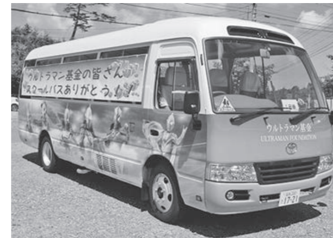
車体の左右に描かれた11人のウルトラヒーロー

今回の寄贈は、円谷プロダクション「ウルトラマン基金」被災地支援の一環によるもので、納車式では同基金の城戸正一事務局長が「ウルトラマ