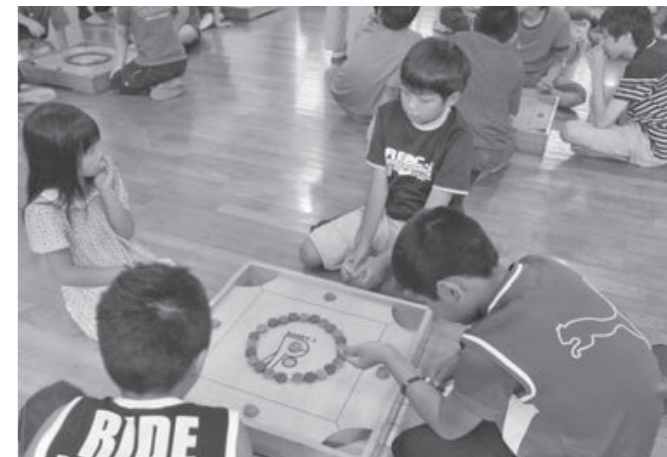
彦根伝承の盤上ゲーム「カロム」に挑戦

で思いっきり遊ぶことができ嬉しかったです「楽しい夏休みの思い出ができ、元氣をもらいました」など、今回の訪問で彦根市の魅力を満喫した3日間となりました。