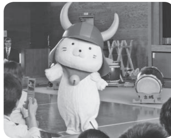
「ひこにゃん」も駆け付けてくれました

で思いっきり遊ぶことができ嬉しかったです「楽しい夏休みの思い出ができ、元氣をもらいました」など、今回の訪問で彦根市の魅力を満喫した3日間となりました。