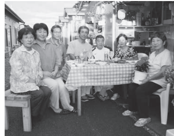
近所の皆さんとともに (本人は写真中央)

私は、広野火力発電所構内で工作中、車を運転している時に地震と津波に遭遇しました。職場で安否確認をした後、津波で車を流された同僚3人を乗せ発電所を出ました。まず先に、町内の海岸近くに住んでいた同僚を送って行きましたが、自宅は津波で流されていたため、内陸部に住む仕事仲間と預けました。次に、私の自宅と避難所に寄り、家族の無事を確認してからもう一人の同僚を南相馬市原町区の自宅まで送っていきましたが、同地区の被害の少なさには驚きました。