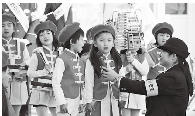
年末年始事件事故防止活動出発式(2008年12月10日撮影)