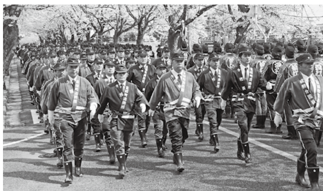
連合検閲式(2010年4月19日撮影)