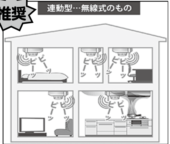
連動型…無線式のもの