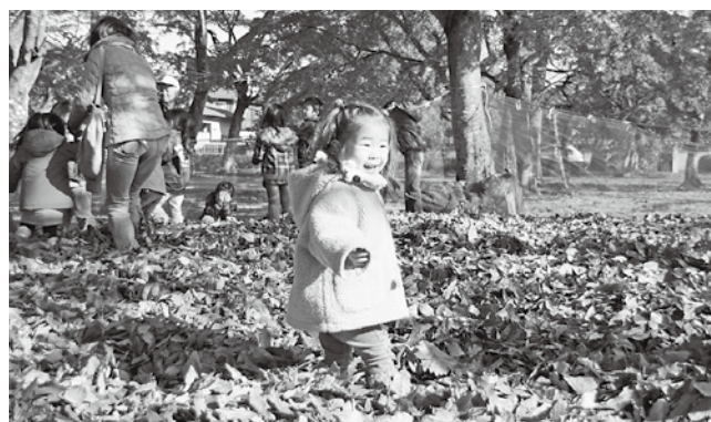
夜の森公園(2010年11月27日撮影)