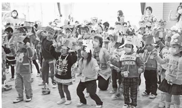
夜の森保育所豆まき(2011年2月3日撮影)