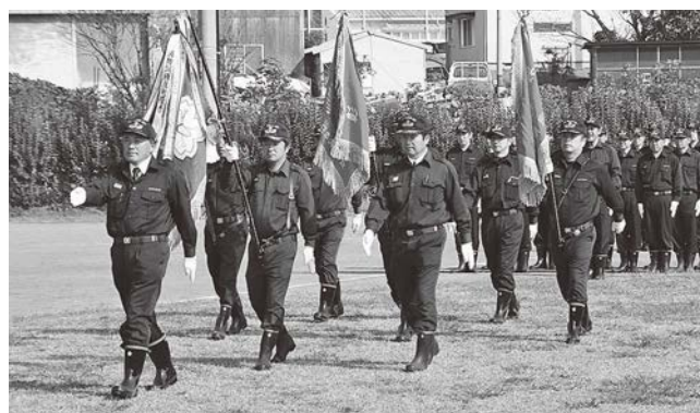
消防団秋季検閲(2009年10月19日撮影)