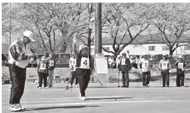
春の交通安全ゲートボール大会(2009年4月9日撮影)