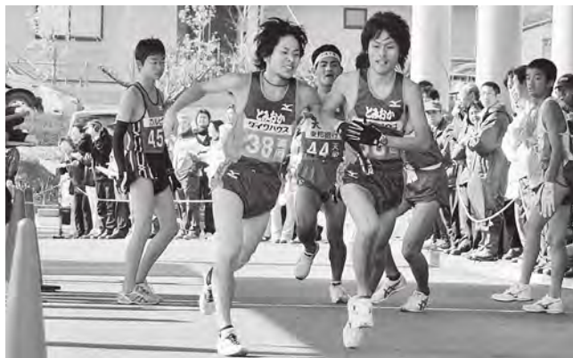
ふくしま駅伝(2007年11月撮影)