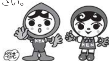
人権イメージキャラクター 人KENまもる君 人KENあゆみちゃん