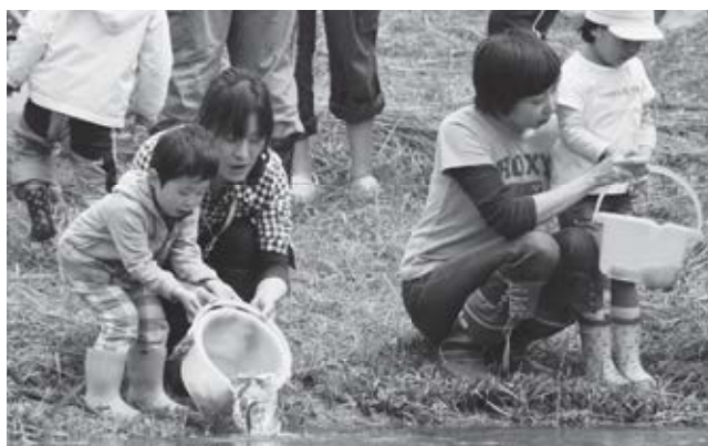
アユの放流(2010年5月撮影)