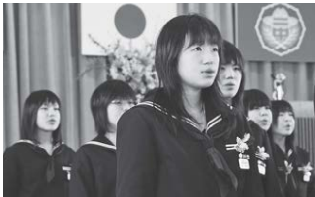
富岡第二中学校卒業式(2008年3月撮影)