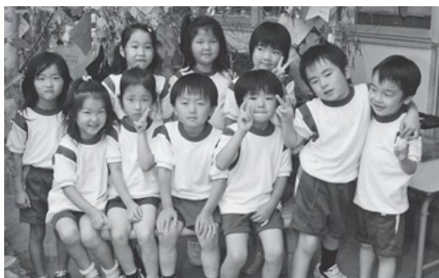
夜の森幼稚園七夕(2008年7月撮影)