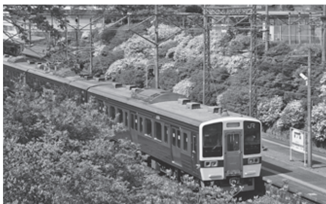
夜ノ森駅(2007年5月撮影)