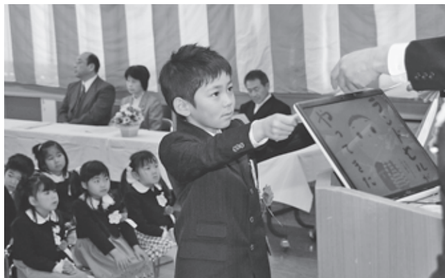
町立富岡幼稚園修了式(2009年)