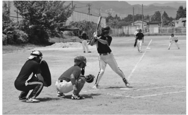
富岡二中グラウンド(2010年8月撮影)