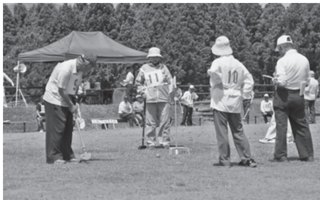
富岡町グラウンド・ゴルフ場(2007年6月撮影)