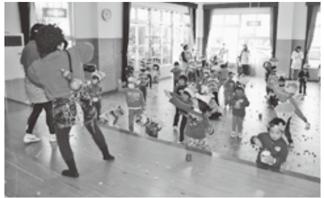
町立夜の森保育所(2010年2月撮影)